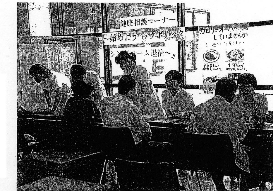
看護師が来訪者に無料で健康相談を行った。(新潟労災病院)

このほかに介護相談や介護用品の展示販売なども行った。また幼稚園児の合唱や職員の歌などミニコンサートも開催された。